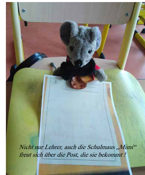
Nicht nur Lehrer, auch die Schulmaus „Mimi“ freut sich über die Post, die sie bekommt!