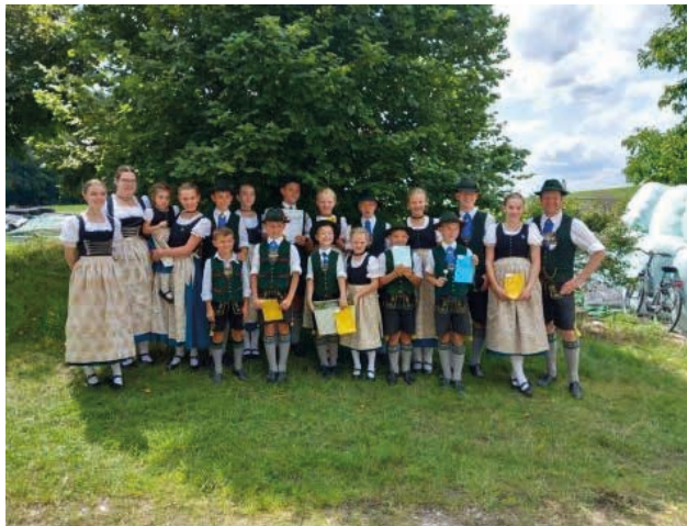
Herzlichen Glückwunsch! Guadwart's!

Gruppen Aktive von 4 Gruppen: 1. Platz und aus der gemischten Vereine Gruppe 2. Platz