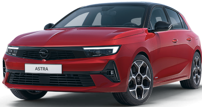
Beispielfoto der Baureihe Astra. Ausstattungsgemeinde ggf. nicht Bestandteil des Angebots