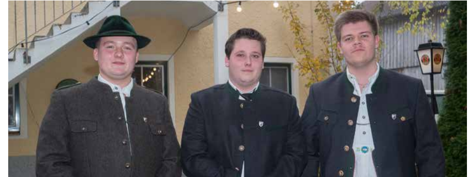
Herzlich willkommen in der Soldaten- und Kriegerkameradschaft Berganger.