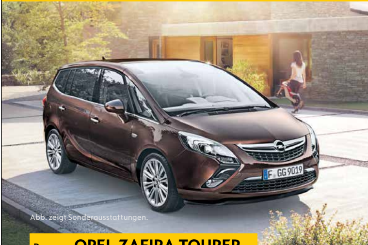
Abb. zeigt Sonderausstattungen.