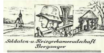
Soldaten- und Kriegerkameradschaft Berganger