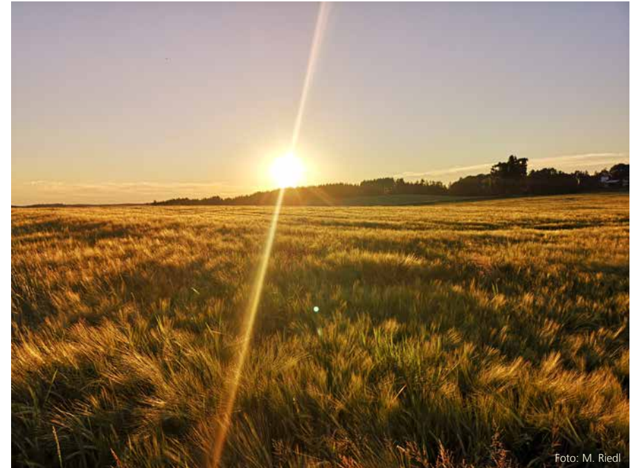
„Abendstimmung über einem Getreidefeld“ in der Gemeinde Baiern

alten Feuerwehrhaus einziehen kann. Dies wird jedoch bis dahin nicht möglich sein, da sich der dortige Neubau noch verzögern wird. Es wird deshalb ein erneutes Übergangsquartier gesucht. Sachdienliche Hinweise und Raumangebote deshalb bitte an uns in der Gemeinde oder direkt an die Mitarbeiter der Kleiderkammer richten.