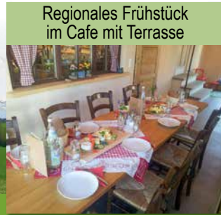
Regionales Frühstück im Cafe mit Terrasse