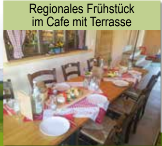
Regionales Frühstück im Cafe mit Terrasse